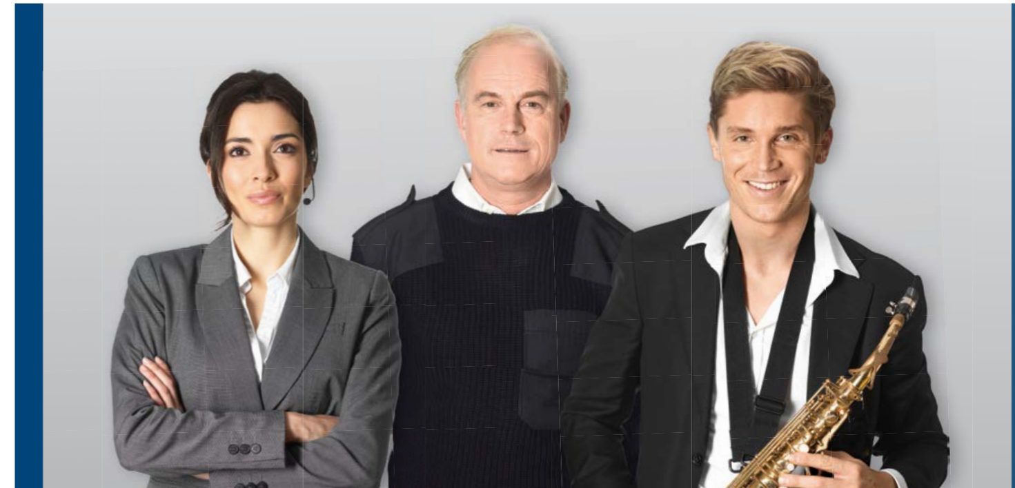
PAVIRO: sistema de chamada e evacuação por voz com qualidade de som profissional

Graças ao seu leque potente de funcionalidades, o PAVIRO não só satisfaz uma variedade muito ampla de requisitos de aplicações, como também fornece o melhor desempenho na sua classe em termos de qualidade, facilidade de instalação e versatilidade. Ao mesmo tempo, minimiza os custos operacionais graças ao baixo consumo de energia e à necessidade de menos baterias.