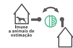
Seleção para imunidade a animais de estimação (apenas modelos WP)