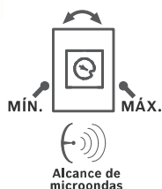
Processamento adaptável de ruído de microondas ajustável